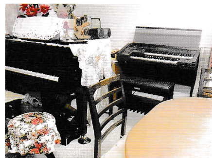
安宅ことば音楽療法教室